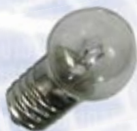
Большая сферическая колба, цоколь с резьбой