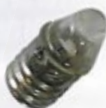
Колба с линзой, цоколь с резьбой