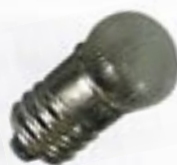
Сферическая колба с рифленным стеклом, цоколь с резьбой