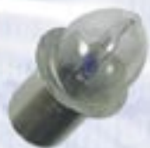
Колба-свеча, цоколь без резьбы