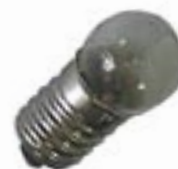
Сферическая колба, цоколь с резьбой